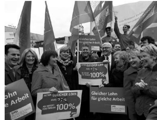
Die SPD-Bundestagsfraktion auf dem diesjährigen Equal-Pay-Day am 25.3.

Unsere Eckpunkte und weitere Informationen finden Sie unter www.spdfraktion.de