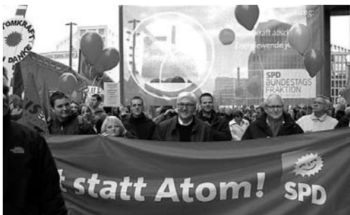
Großdemo gegen Atomkraftwerke in Berlin am 26.3.

Die Energiewende ist so angelegt, dass schrittweise über einen Zeitraum bis 2050 alle fossilen und atomaren Energieträger durch solche ersetzt werden, die wieder nachwachsen oder von der Witterung erzeugt werden.